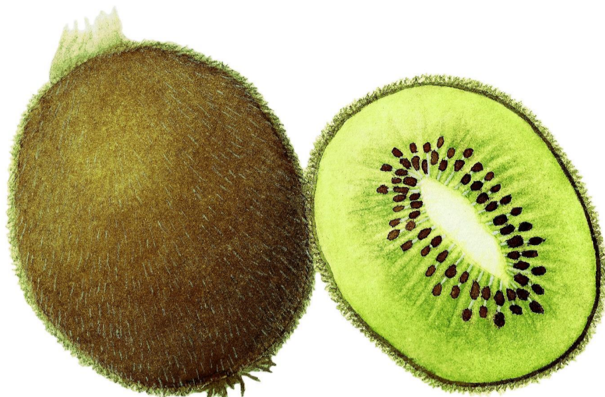
Ilustração científica: Francisca Cavaleiro

19-21 e 26-28 de Outubro de 2017 Horário pós-laboral